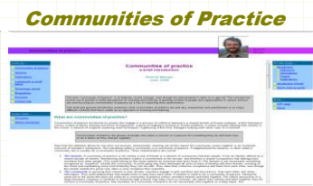
Communities of Practice