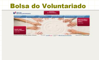
Bolsa do Voluntariado